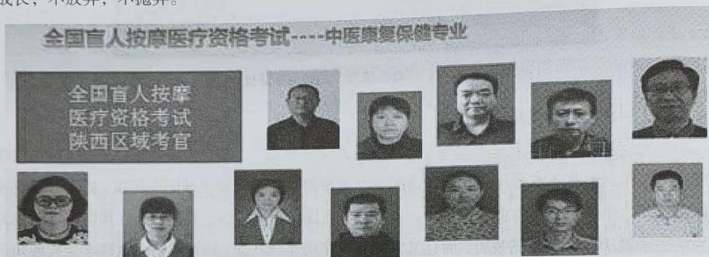
图三：我校中医康复保健专业 12 名教师担任全国盲人按摩医疗资格考试陕西区域考官

大爱之心育人才。锻炼特教教师“三心”。“一心”是爱心，悦纳残疾学生，提倡爱别人的孩子才是真正具有爱心之人，提高平等的对待每位学生，让残疾学生感受到来自教师的尊重和关注，去标签化，不歧视，不厚此薄彼；“二心”是耐心，面对残疾学生的复杂情况，尊重个性背景和特点，因材施教，不急躁，不浮躁；“三心”是恒心，给残疾学生赋能，促进残疾学生全面成长，不放弃，不抛弃。