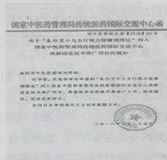
图二：学校引入企业国家中医药管理局传统医药国际交流项目“脊柱堂小儿五行视力保健调护法”进课堂。