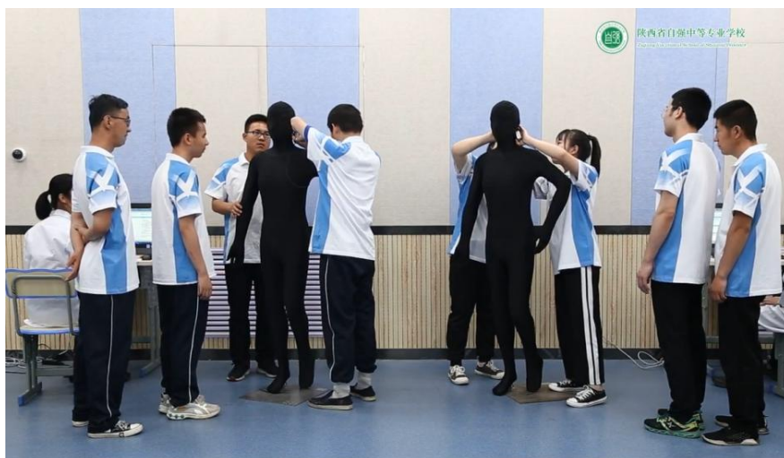
残健学生分组比赛取穴