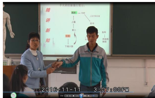
盲生“模特”协助教师展示经络循行路线