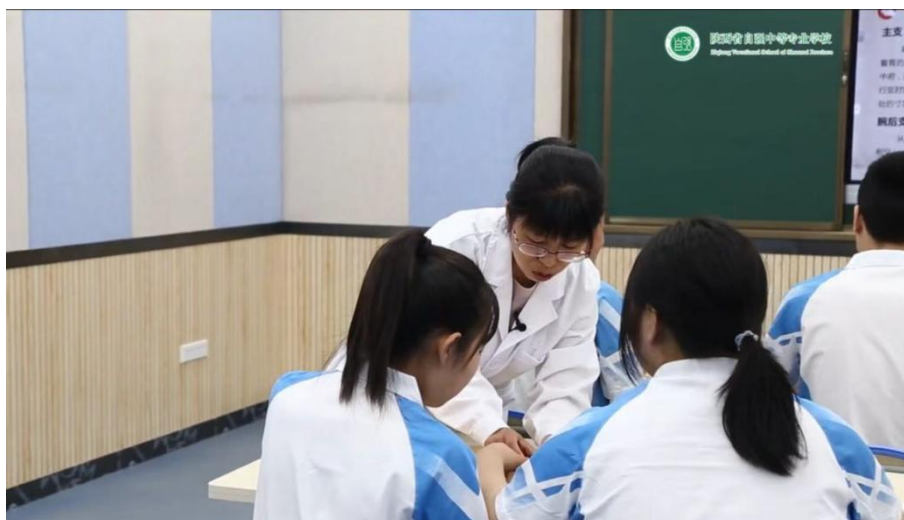
教师指导健全生给盲生取穴