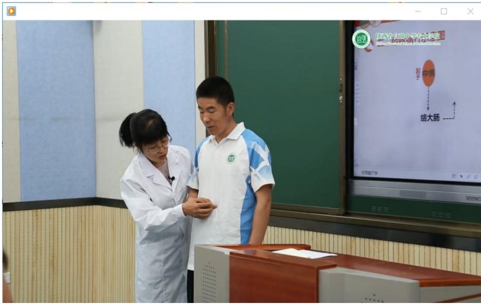
教师手把手指导盲生循取经络循行路线