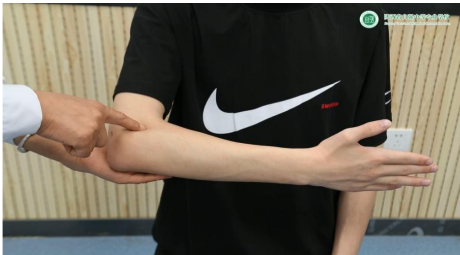
教师指导健全生取穴