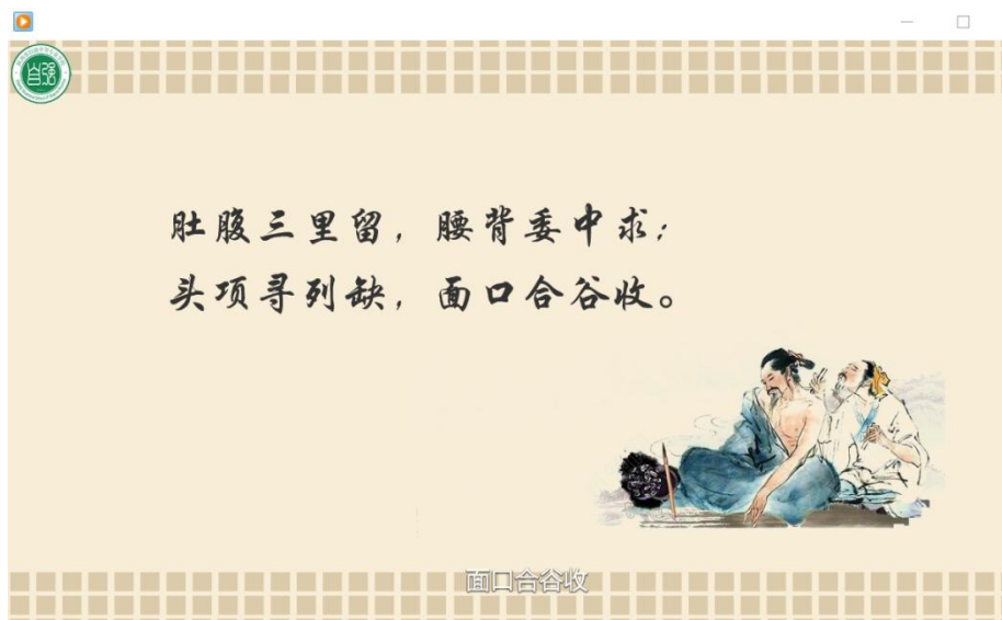
歌诀记忆法在教学中的应用