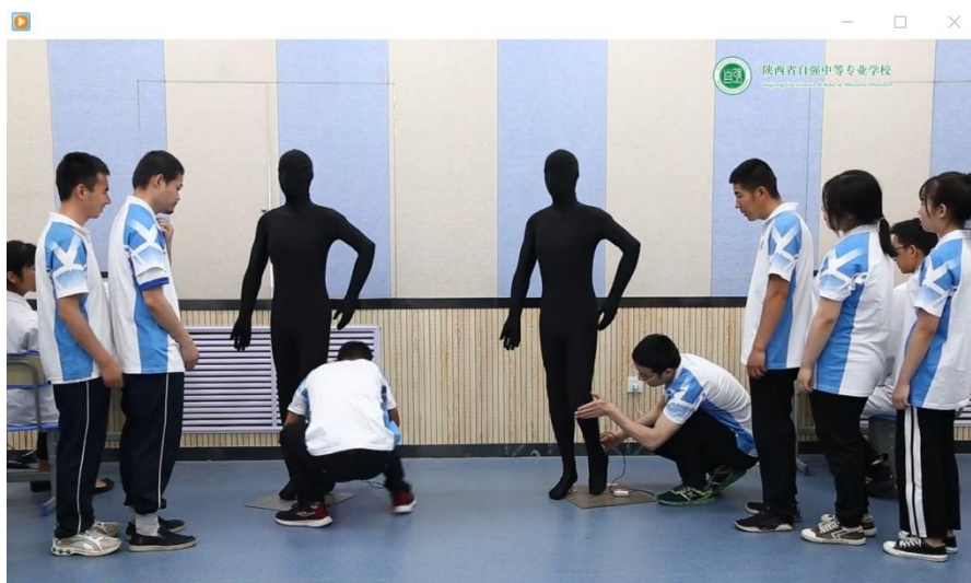
残健学生分组比赛