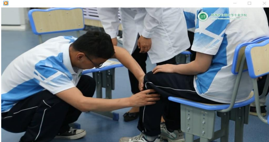
健全学生给盲生取穴