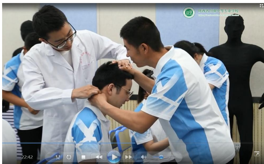
教师手把手指导盲生给健全生取穴