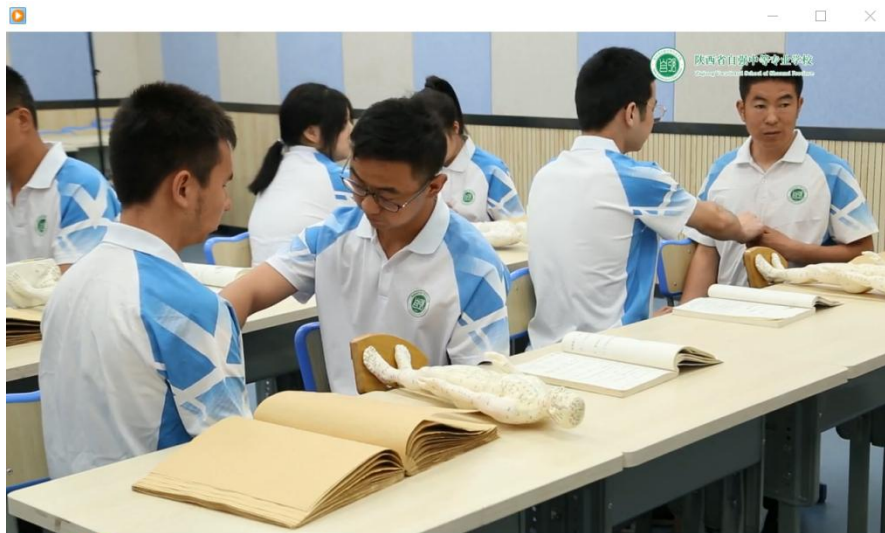
残健学生课堂分组互助学习